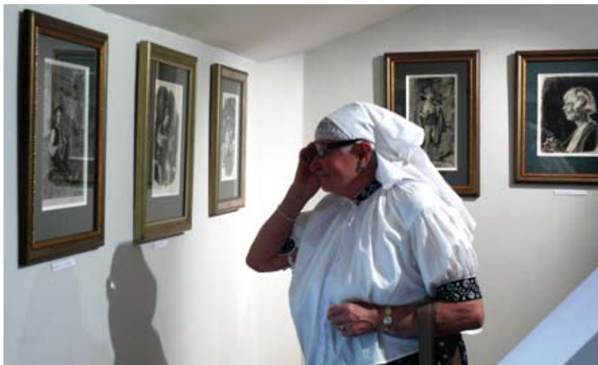
Świat w drzeworytach Jana Wałacha można oglądać w Zamku Cieszyn.

Scenki rodzajowe z życia górali istebniańskich, ich kultura, beskidzkie krajobrazy oraz architektura kilku miast Europy. Wszystko to można znaleźć na niezwyklej wystawie „Świat w drzeworytach Jana Wałacha”. Do 4 listopada kilkadziesiąt drzeworytów pochodzących ze zbiorów pracowni Jana Wałacha, której patronuje Stowarzyszenie im. artysty Jana Wałacha w Istebnej można oglądać w Zamku Cieszyn.