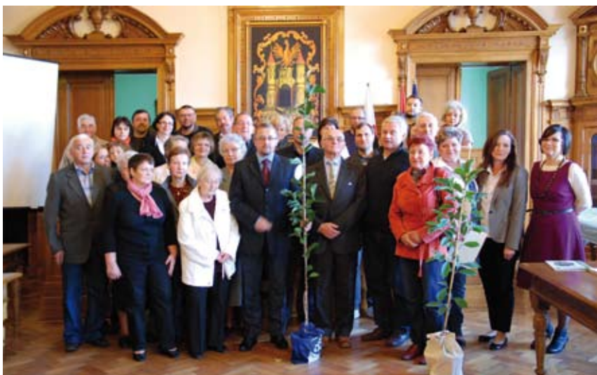
Właściciele wyróżnionych ogrodów na spotkaniu w Ratuszu.