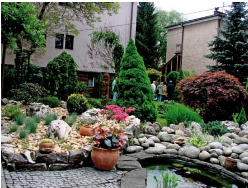
Zachwycający ogród państwa Dudów.