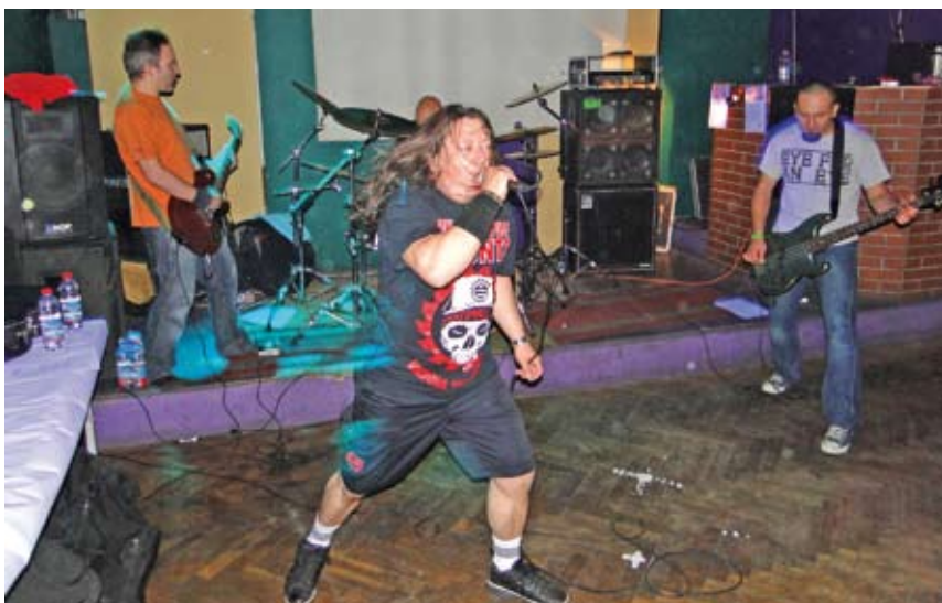
To już druga edycja festiwalu organizowanego dla miłośników mocniejszego brzmienia.

Podczas imprezy można było się zapoznać z propozycjami organizacji Vege Inicjatywa i spróbować wegetariańskie-