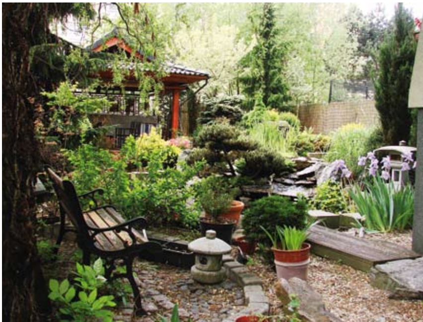
Przepiękny ogród państwa Krystów, utrzymany w stylu japońskim.