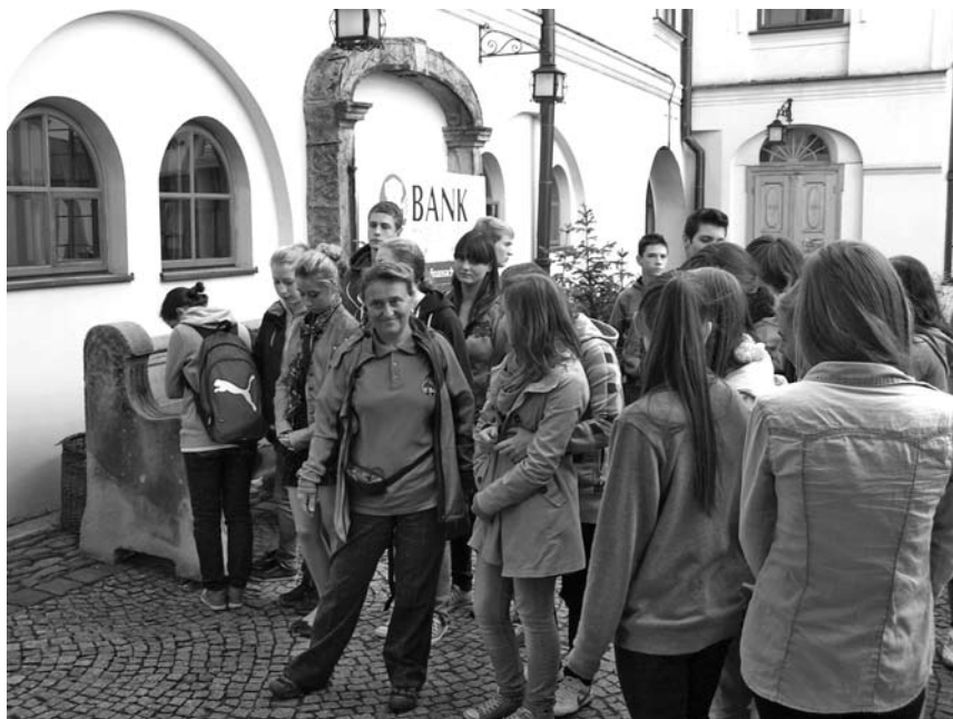
„Szlakiem Tolerancji” spacerowała młodzież ze szkół ponadgimnazjalnych Cieszyna i Czeskiego Cieszyna.

Po zakończeniu wycieczek przeprowadzono wśród młodzieży ankietę, z której wynika, że młodzież przed wycieczką oceniła swoją wiedzę na temat sławnych Cieszyńiaków jako słabą (204 ankietowanych). Po wycieczce zauwa-