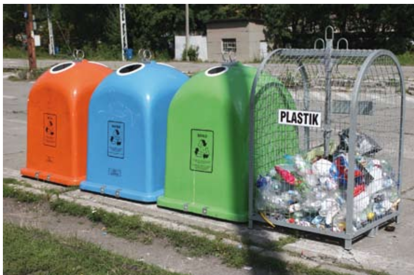
Mieszkańców Cieszyna w 2013 r. czekają zmiany w zakresie odbioru odpadów komunalnych.

wość ustalenia wysokości opłaty za gospodarowanie odpadami komunalnymi w zależności od: